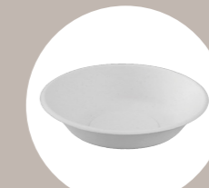
piatti & vassoi plates, bowls & trays