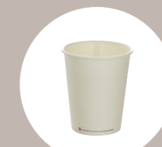
bicchieri bevande calde hot cups