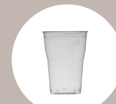
bicchieri bevande fredde cold cups