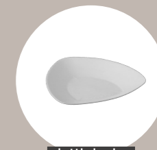
piatti design design plates