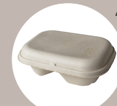
linea pure pulp pure pulp line