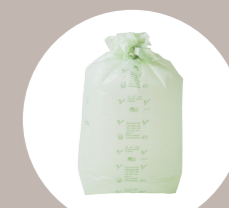
raccolta rifiuti waste collection